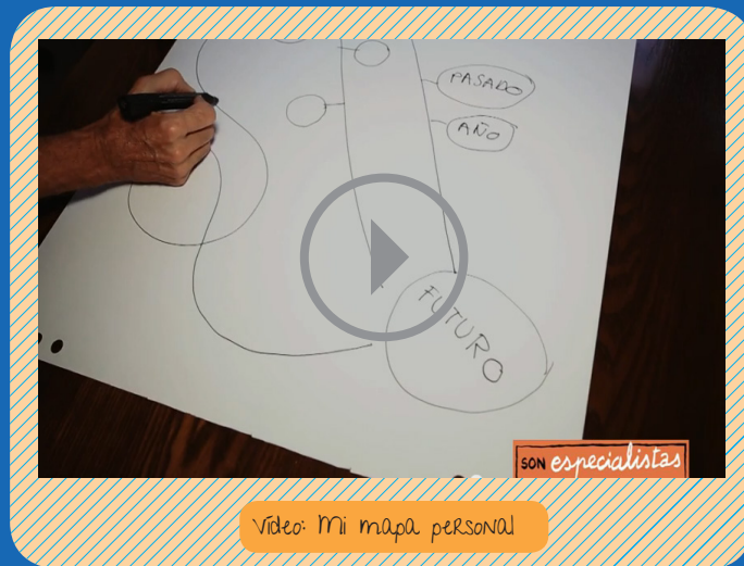
Vídeo: Mi mapa personal

El futuro es siempre impredecible. Nadie puede asegurarnos lo que pasará o no en nuestras vidas porque el futuro es algo que construimos día a día. En ocasiones las cosas ocurrirán tal y como las habíamos pensado. Otras veces nos sorprenderemos al encontrarnos con situaciones o posibilidades que no habíamos llegado ni a imaginar. Algunas cosas nos saldrán bien y es posible que otras no tanto como quisiéramos, pero es importante que no dejemos de proyectar nuestros sueños y que sigamos intentando cumplirlos.